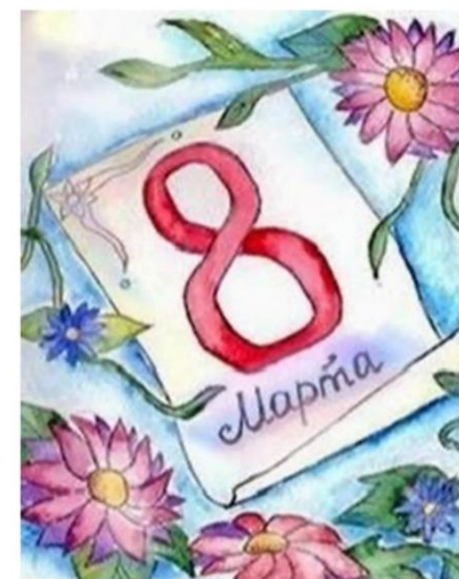
Рисунок Миланы Галенко, 8 Б класс