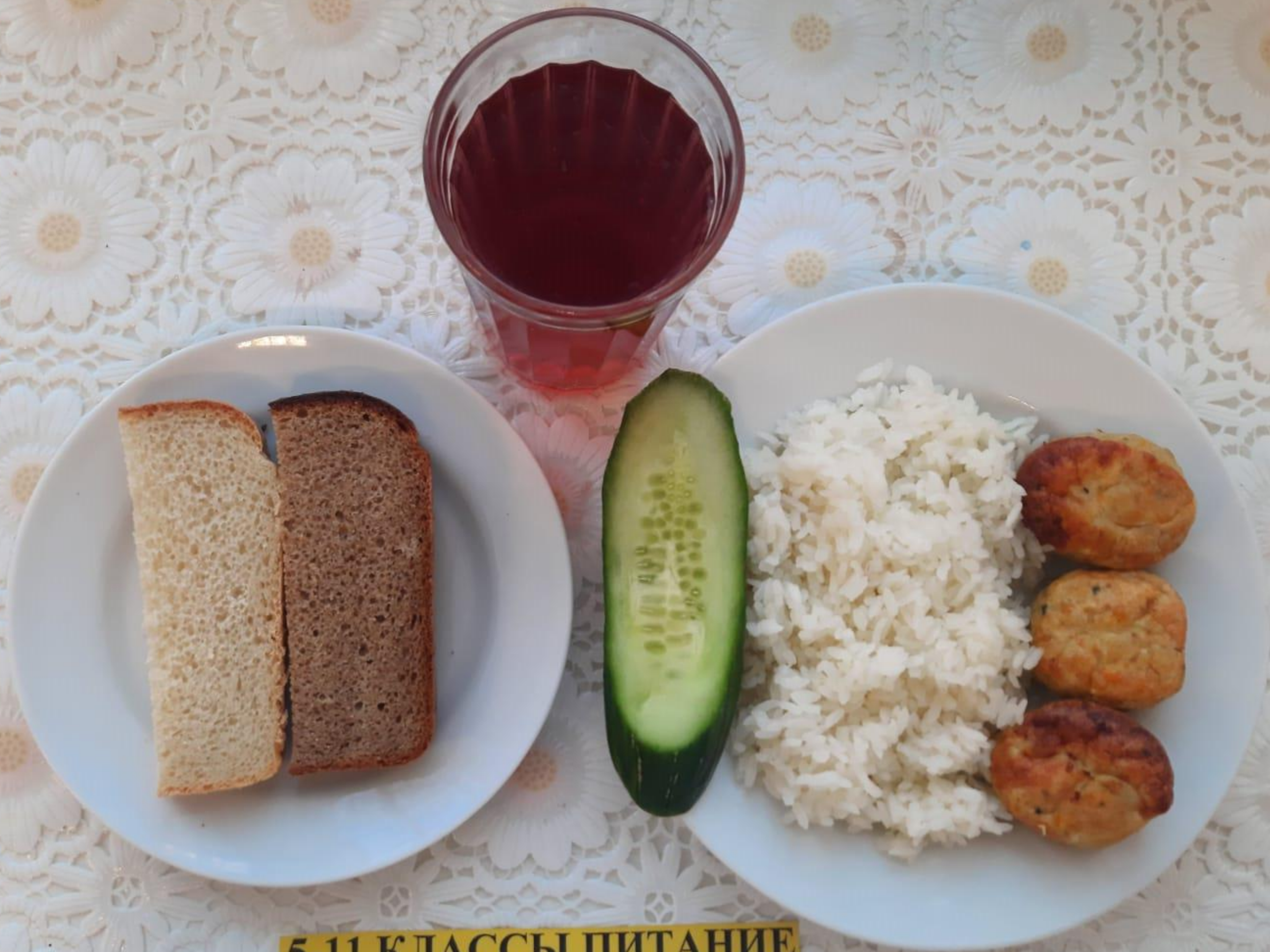
5-11 КЛАССЫ ПИТАНИЕ ЗА РОДИТЕЛЬСКУЮ ПЛАТУ (1СМЕНА)