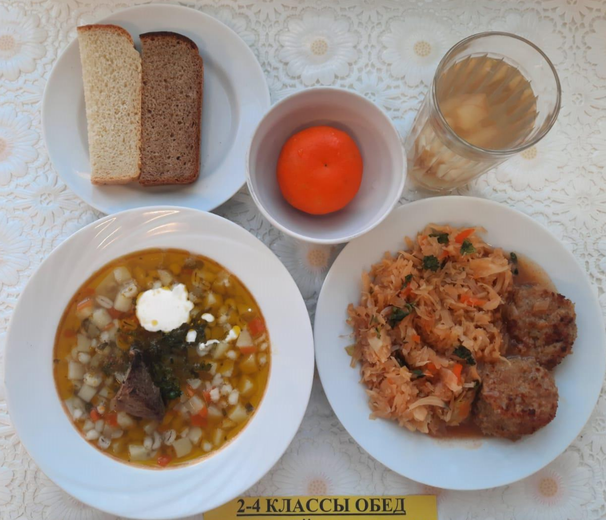
2-4 КЛАССЫ ОБЕД ЛЬГОТНОЙ КАТЕГОРИИ (1 И 2 СМЕНА)