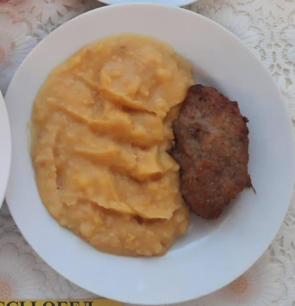
5-11 КЛАССЫ ОБЕД ЛЬГОТНОЙ КАТЕГОРИИ (1 И 2 СМЕНА)