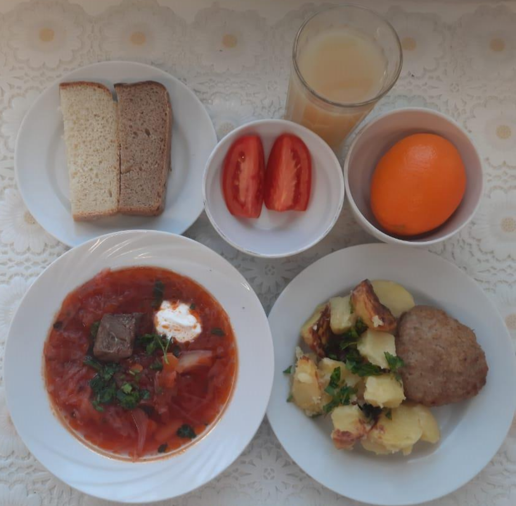
2-4 КЛАССЫ ОБЕД ЛЬГОТНОЙ КАТЕГОРИИ (1 И 2 СМЕНА)