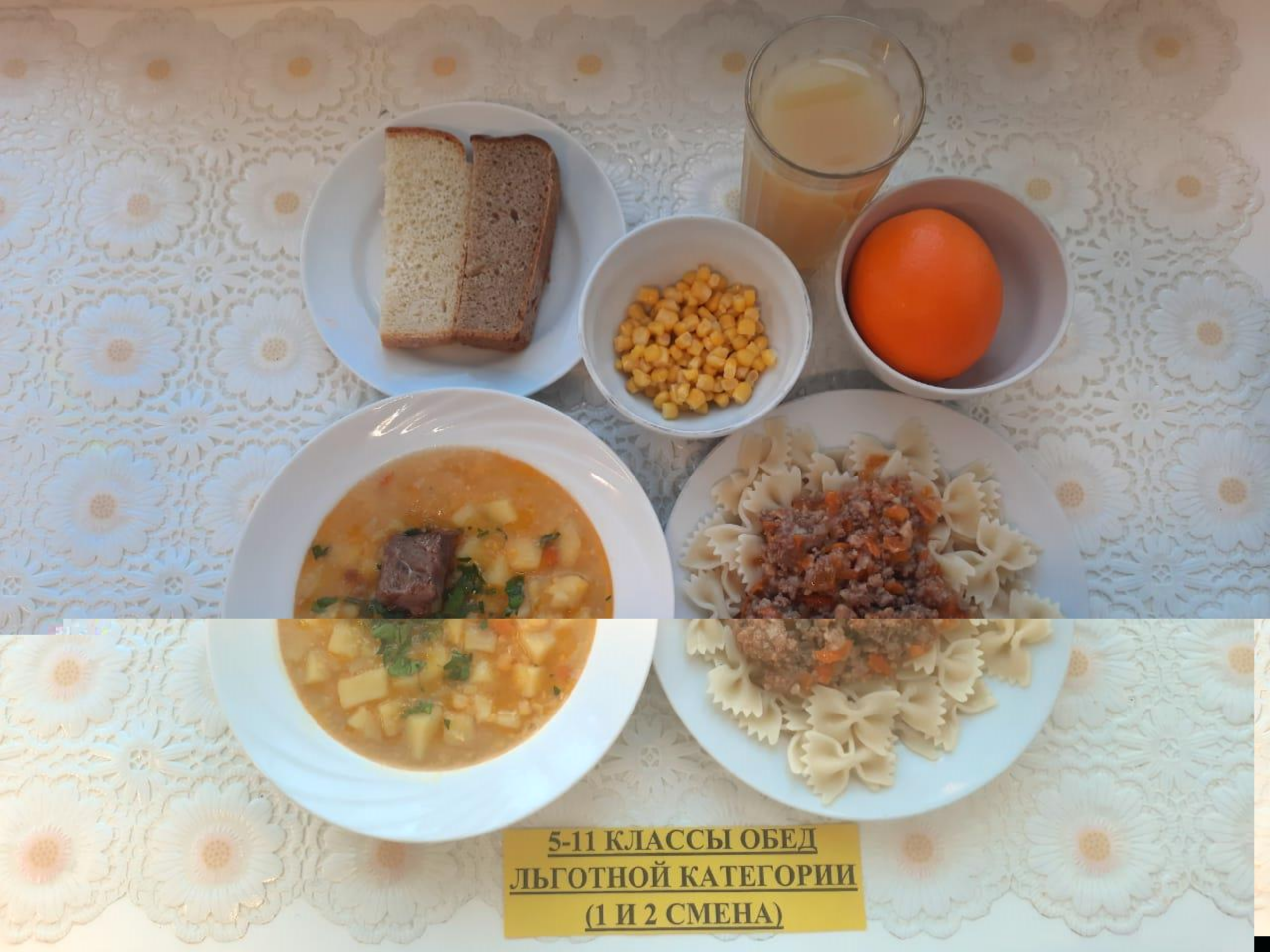
5-11 КЛАССЫ ОБЕД ЛЬГОТНОЙ КАТЕГОРИИ (1 И 2 СМЕНА)