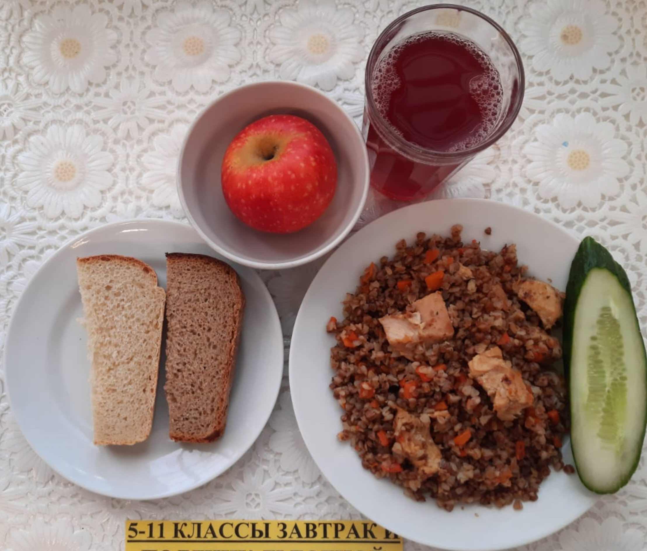
5-11 КЛАССЫ ЗАВТРАК И ПОЛДНИК ЛЬГОТНОЙ КАТЕГОРИИ (1 И 2 СМЕНА)