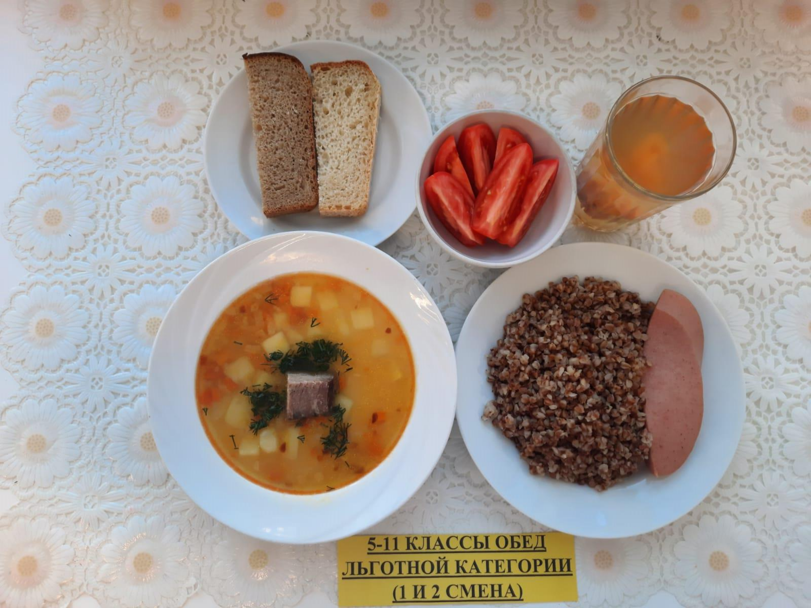
5-11 КЛАССЫ ОБЕД ЛЬГОТНОЙ КАТЕГОРИИ (1 И 2 СМЕНА)