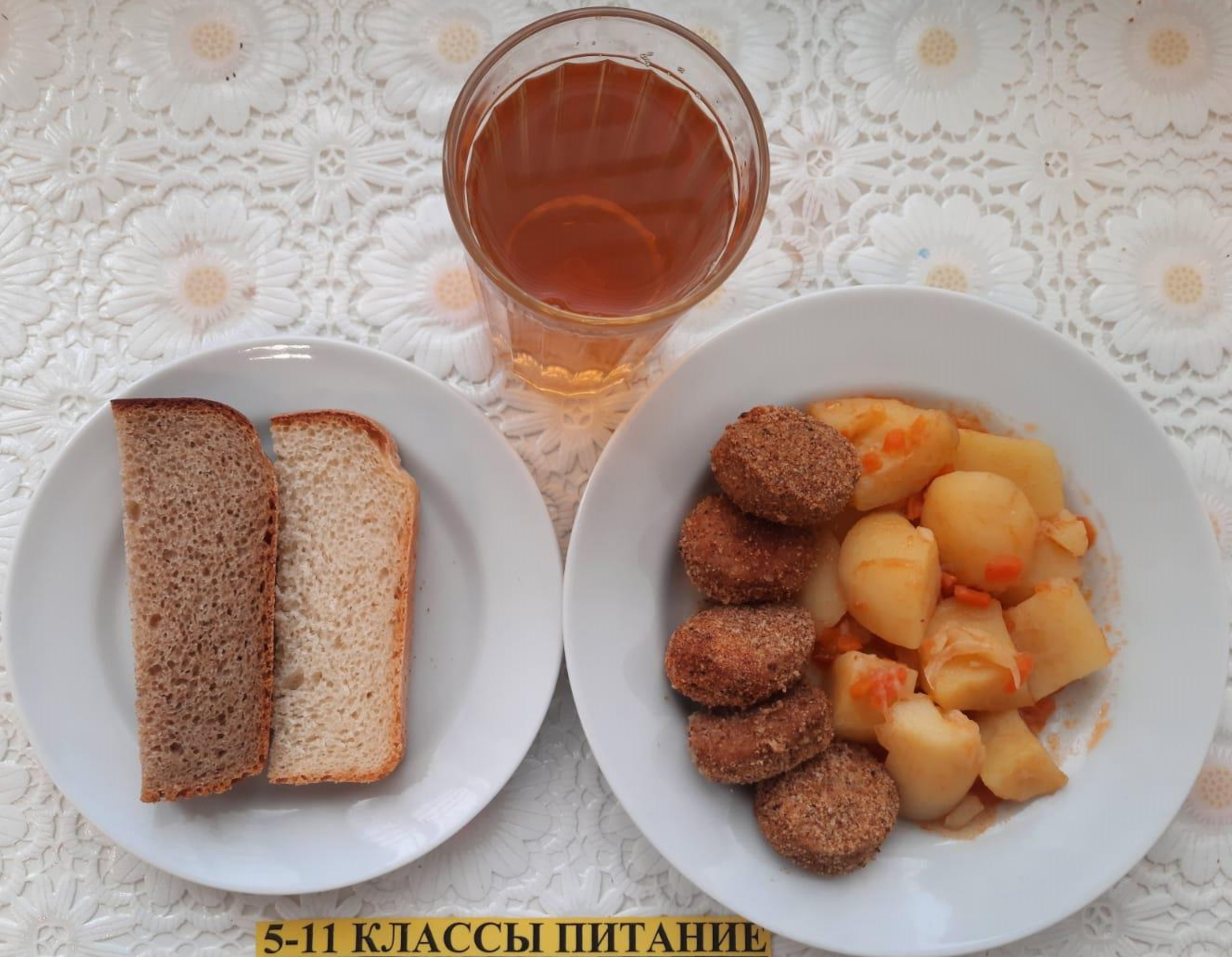
5-11 КЛАССЫ ПИТАНИЕ ЗА РОДИТЕЛЬСКУЮ ПЛАТУ (1СМЕНА)