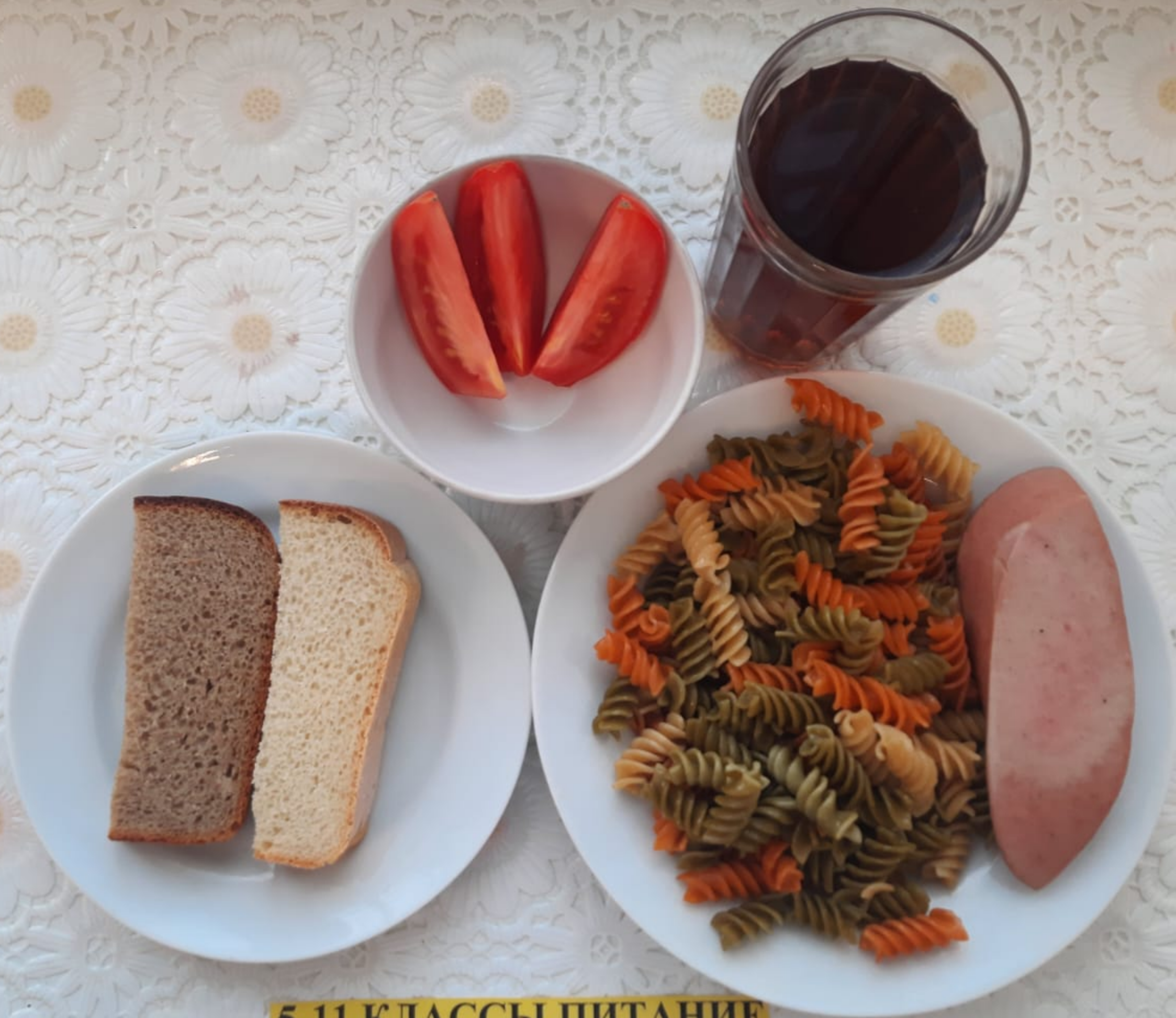
5-11 КЛАССЫ ПИТАНИЕ ЗА РОДИТЕЛЬСКУЮ ПЛАТУ (1СМЕНА)