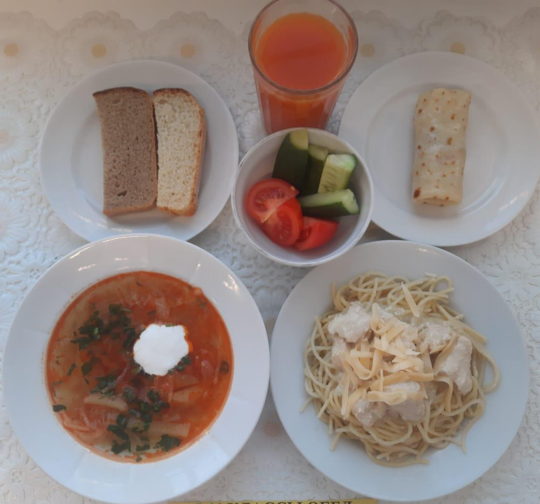
5-11 КЛАССЫ ОБЕД ЛЬГОТНОЙ КАТЕГОРИИ (1 И 2 СМЕНА)