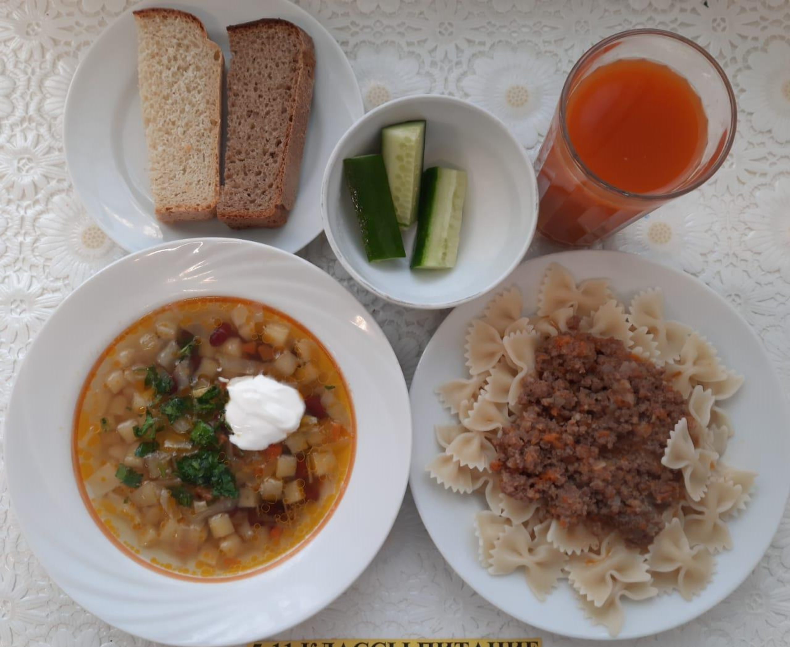
5-11 КЛАССЫ ПИТАНИЕ ЗА РОДИТЕЛЬСКУЮ ПЛАТУ (2СМЕНА)