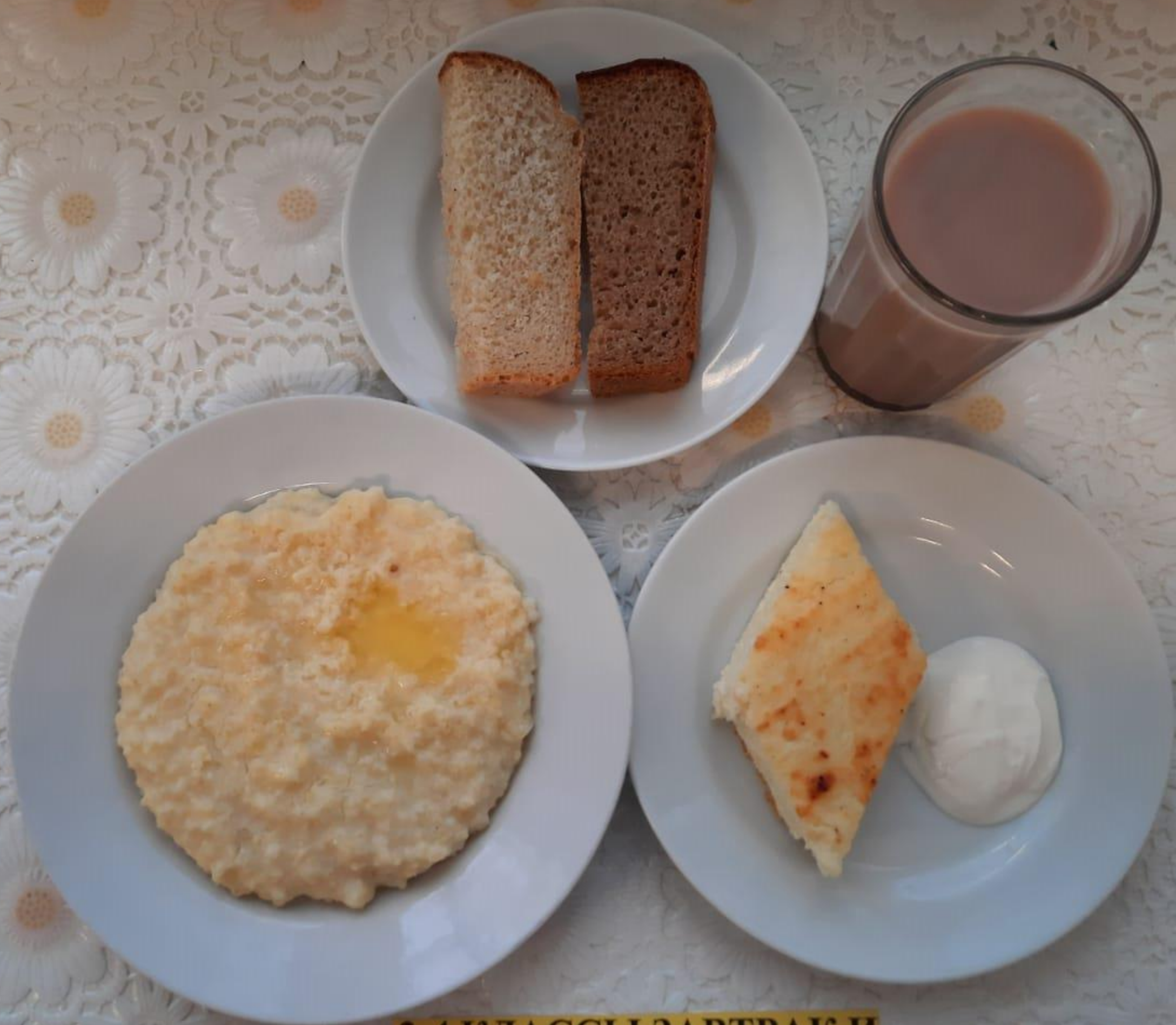
2-4 КЛАССЫ ЗАВТРАК И ПОЛДНИК ЛЬГОТНОЙ КАТЕГОРИИ (1 И 2 СМЕНА)