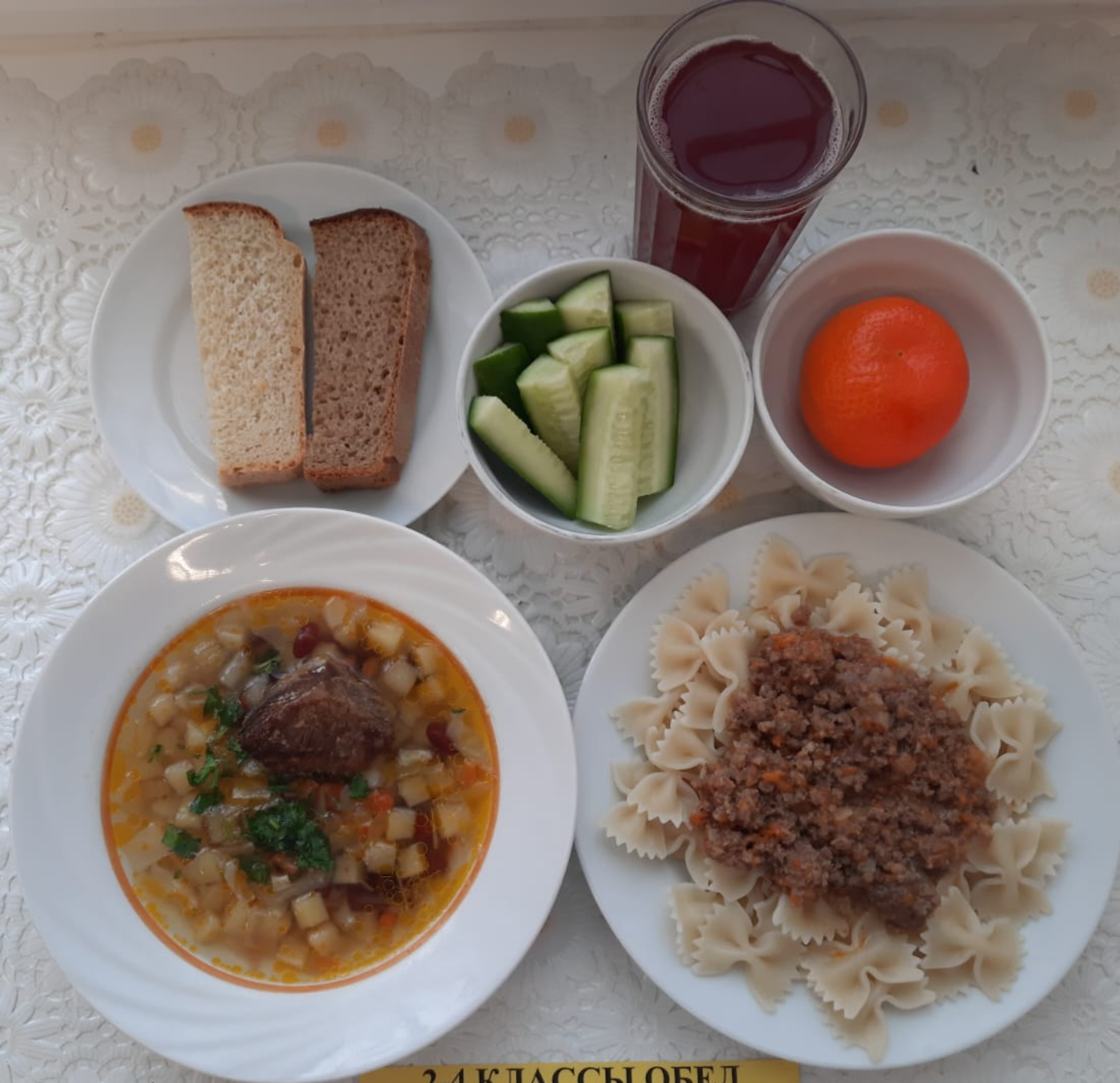
2-4 КЛАССЫ ОБЕД ЛЬГОТНОЙ КАТЕГОРИИ (1 И 2 СМЕНА)