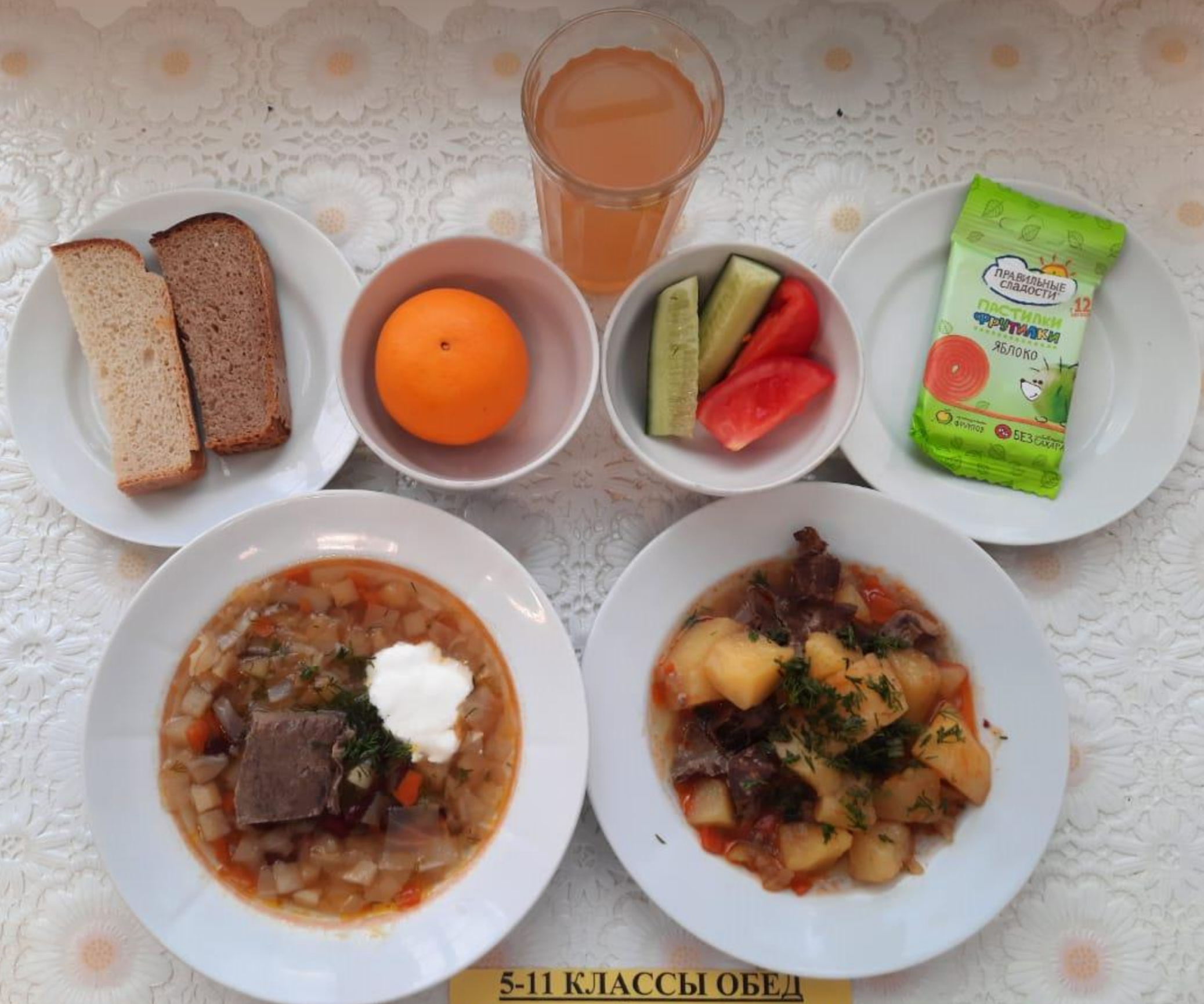
5-11 КЛАССЫ ОБЕД Льготной категории (1 и 2 смена)