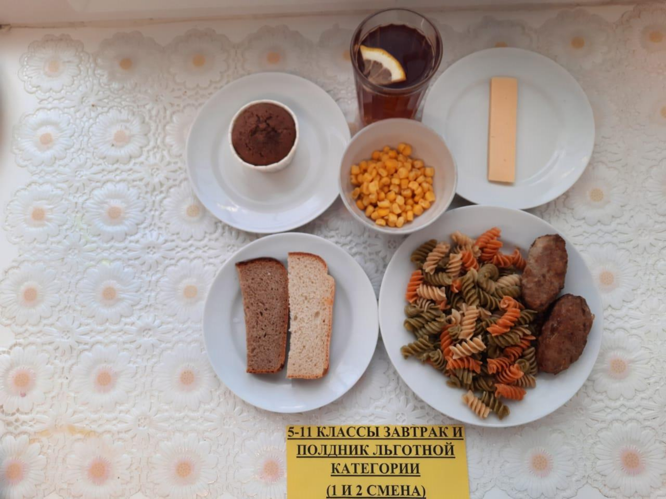
5-11 КЛАССЫ ЗАВТРАК И ПОЛДНИК ЛЬГОТНОЙ КАТЕГОРИИ (1 И 2 СМЕНА)