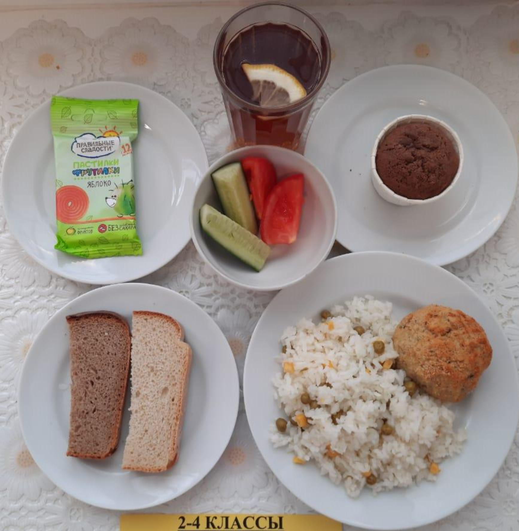
2-4 КЛАССЫ БЕСПЛАТНОЕ ПИТАНИЕ (1СМЕНА)