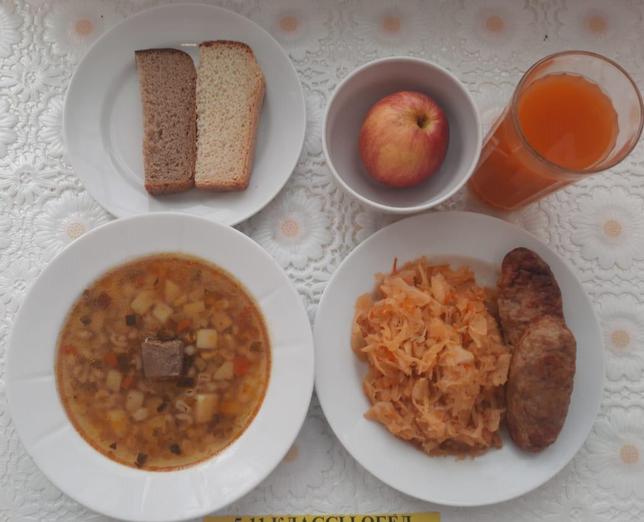
5-11 КЛАССЫ ОБЕД ЛЬГОТНОЙ КАТЕГОРИИ (1 И 2 СМЕНА)