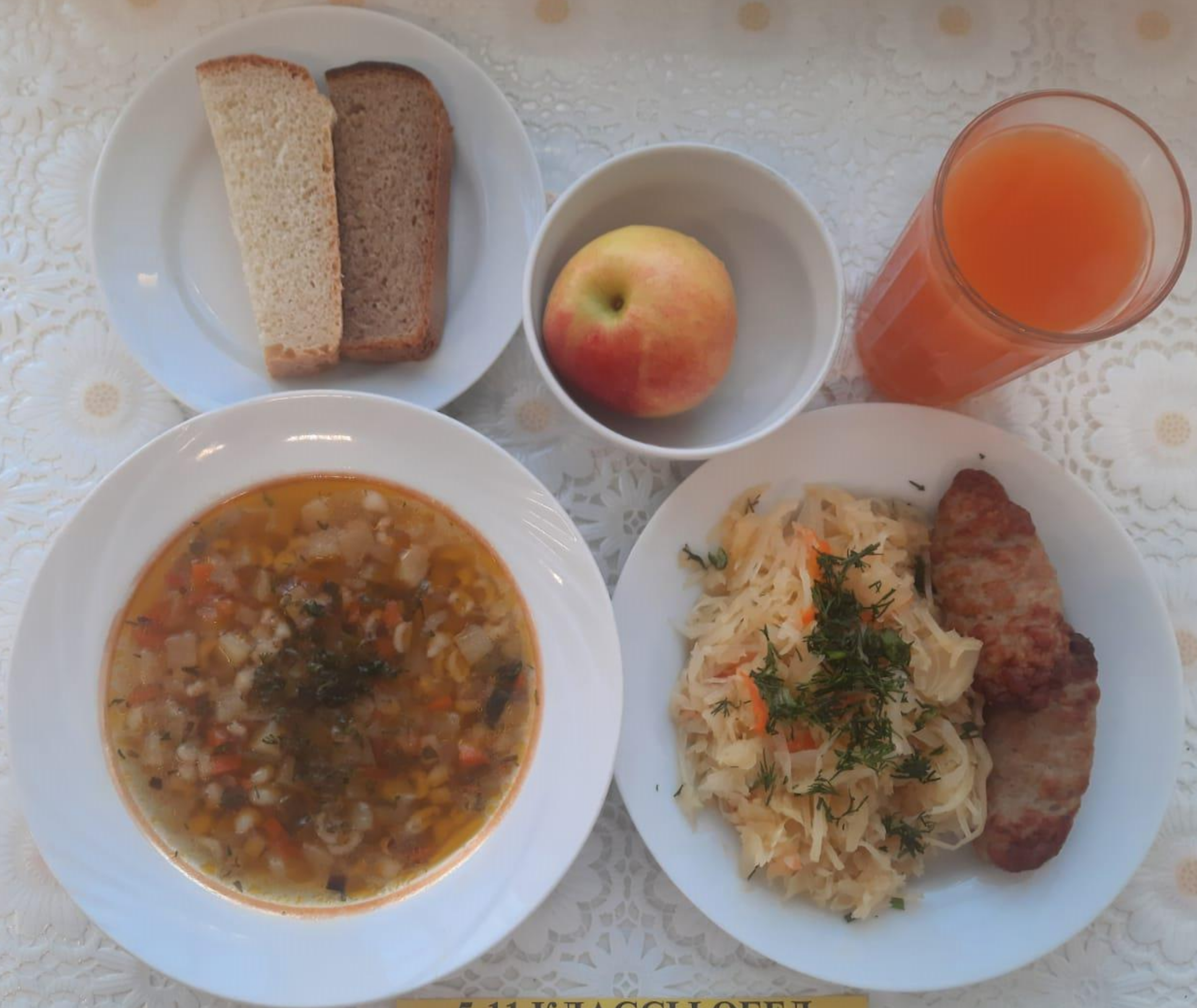
5-11 КЛАССЫ ОБЕД ЛЬГОТНОЙ КАТЕГОРИИ (1 И 2 СМЕНА)