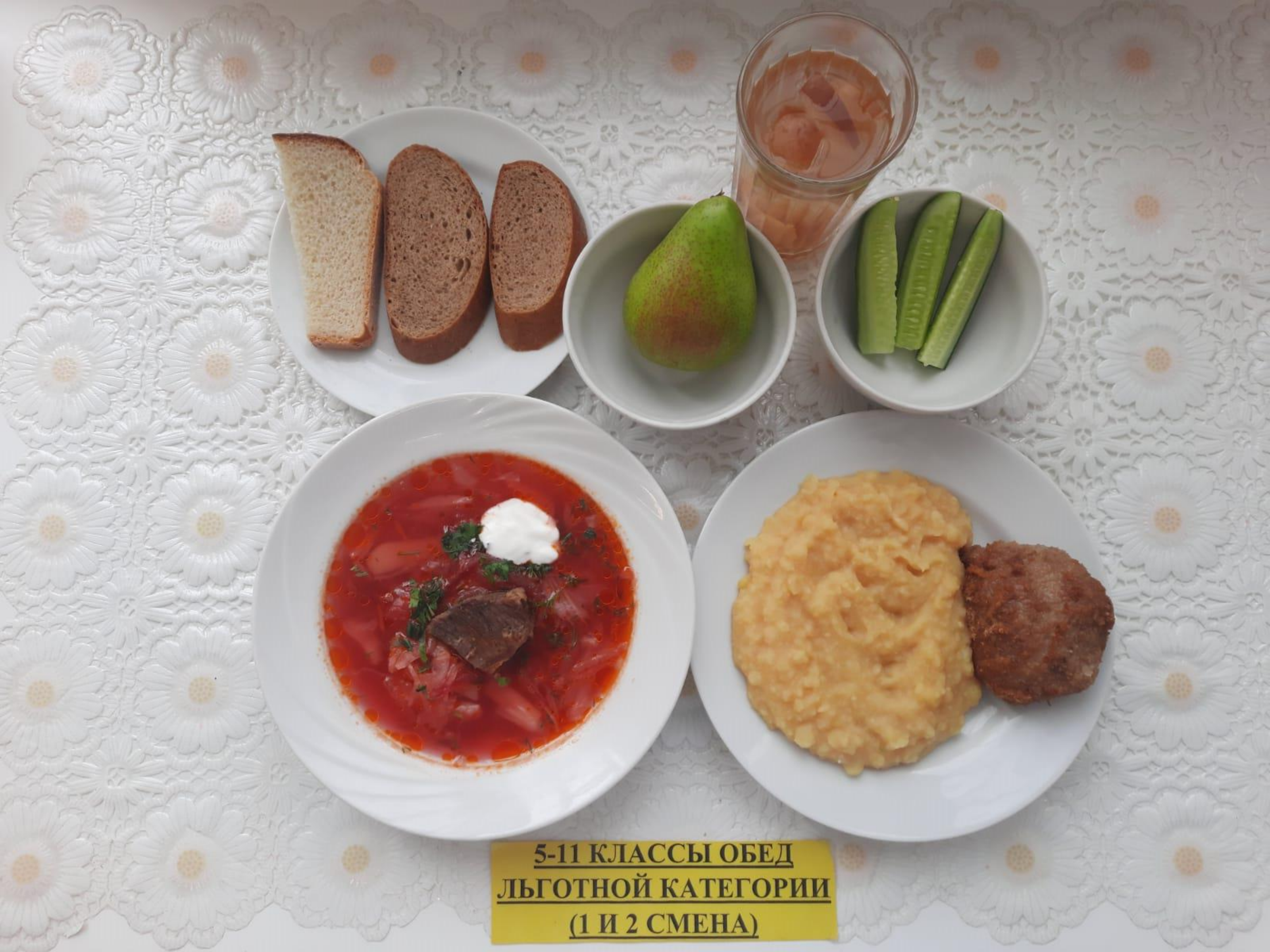
5-11 КЛАССЫ ОБЕД ЛЬГОТНОЙ КАТЕГОРИИ (1 И 2 СМЕНА)