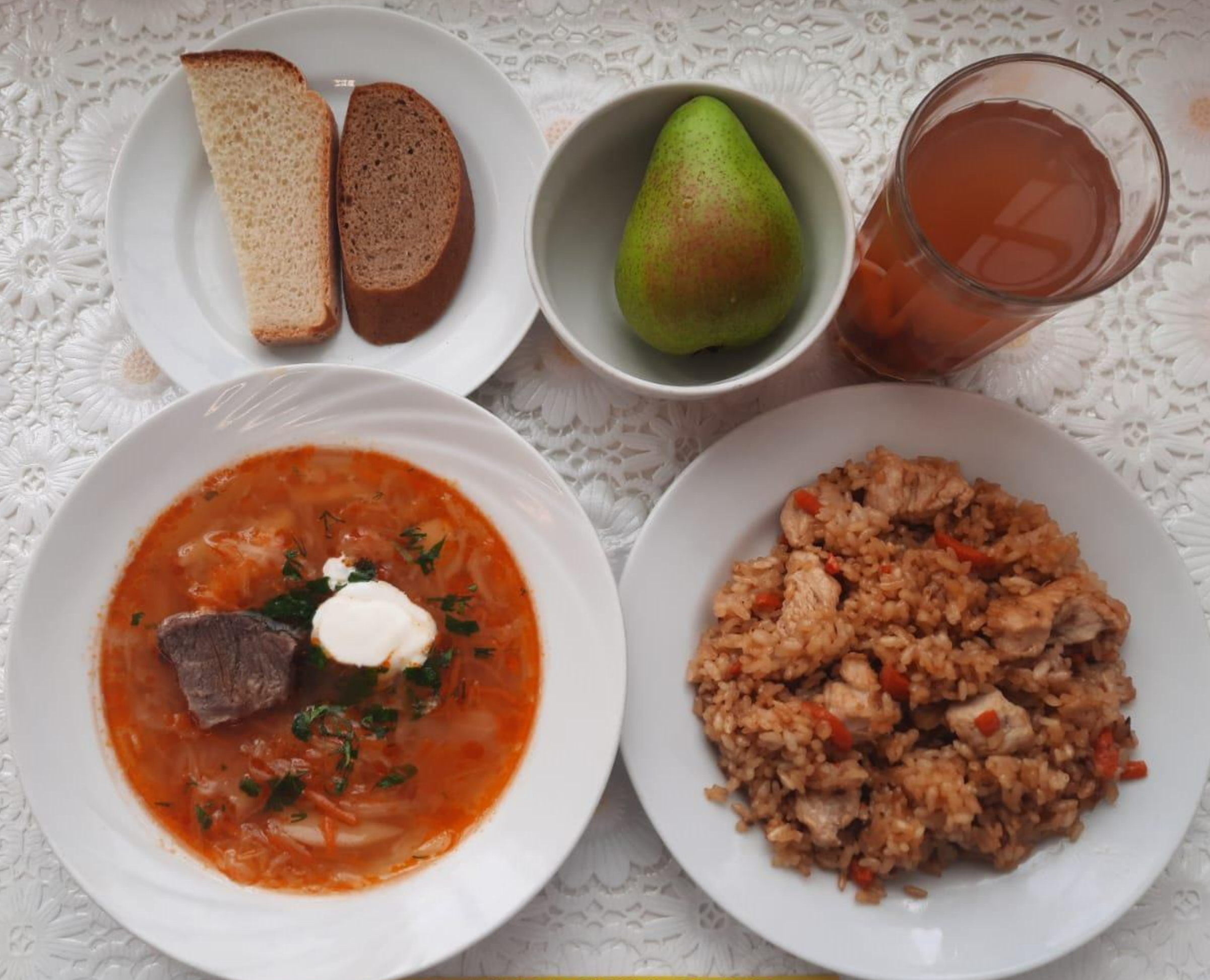
2-4 КЛАССЫ ОБЕД ЛЬГОТНОЙ КАТЕГОРИИ (1 И 2 СМЕНА)