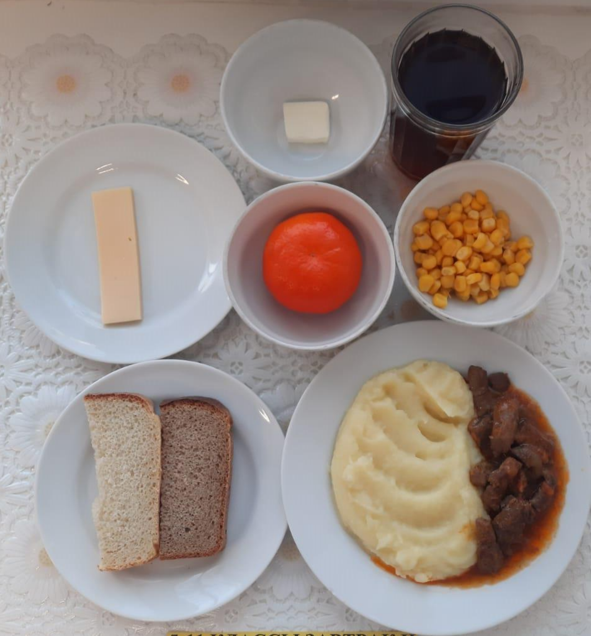
5-11 КЛАССЫ ЗАВТРАК И ПОЛДНИК ЛЬГОТНОЙ КАТЕГОРИИ (1 И 2 СМЕНА)