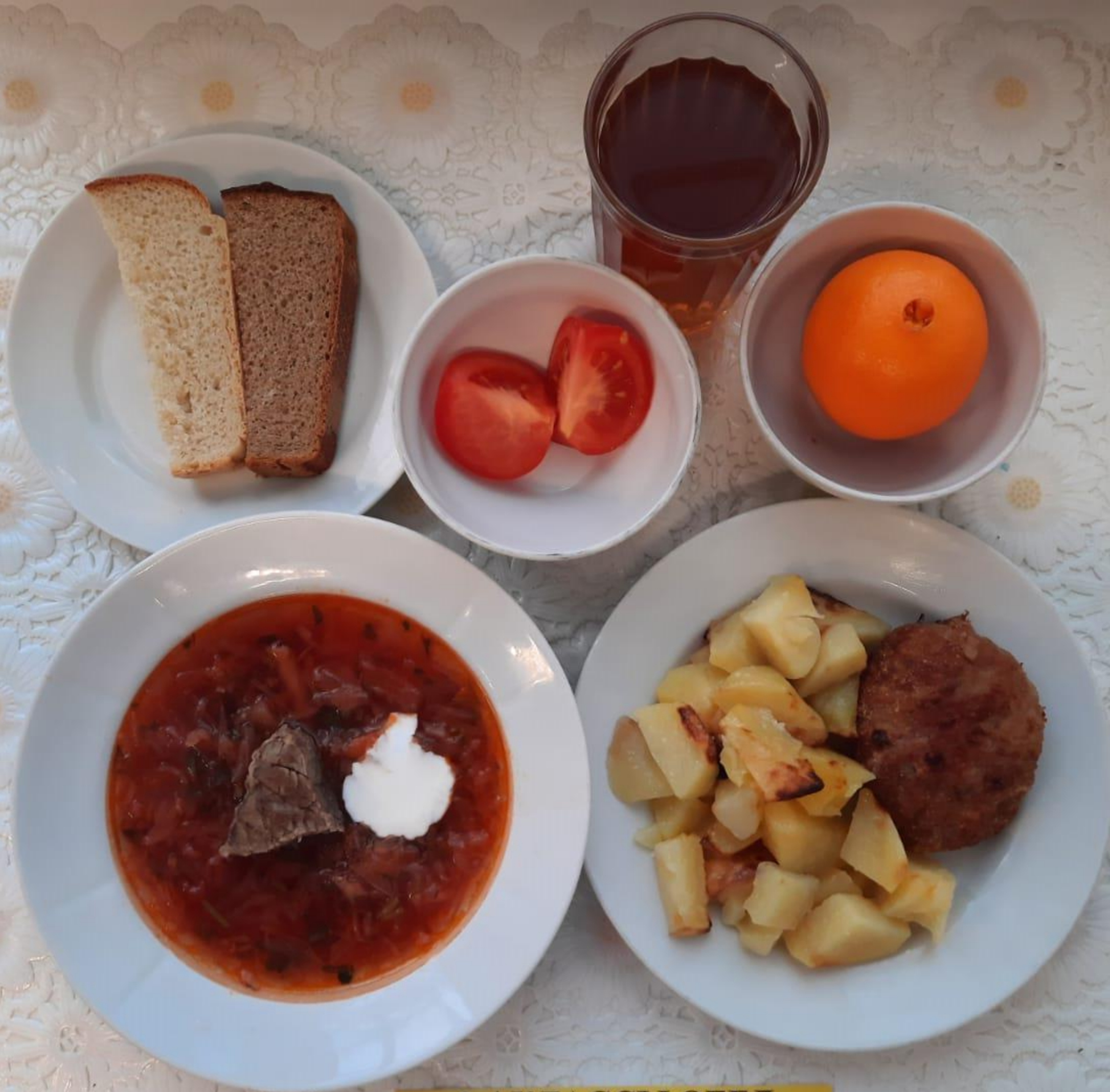
2-4 КЛАССЫ ОБЕД ЛЬГОТНОЙ КАТЕГОРИИ (1 И 2 СМЕНА)