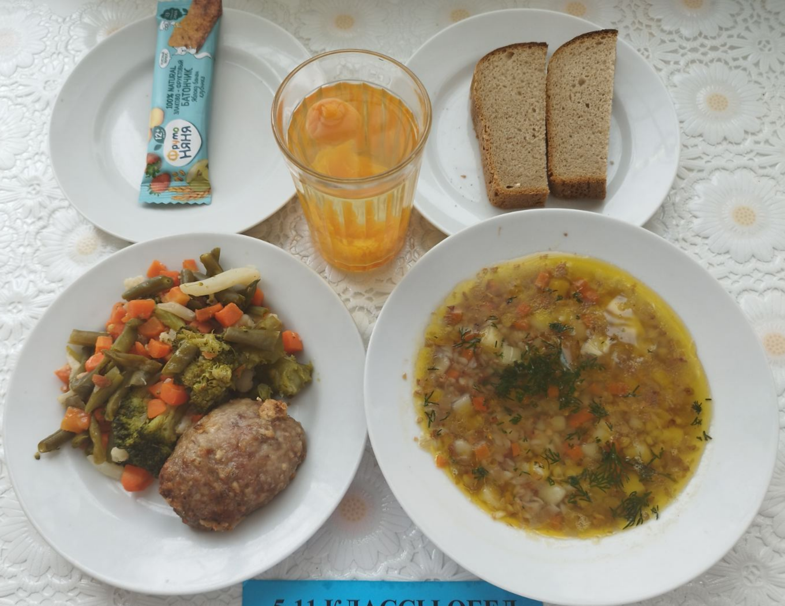
5-11 КЛАССЫ ОБЕД ЛЬГОТНОЙ КАТЕГОРИИ САХАРНЫЙ ДИАБЕТ