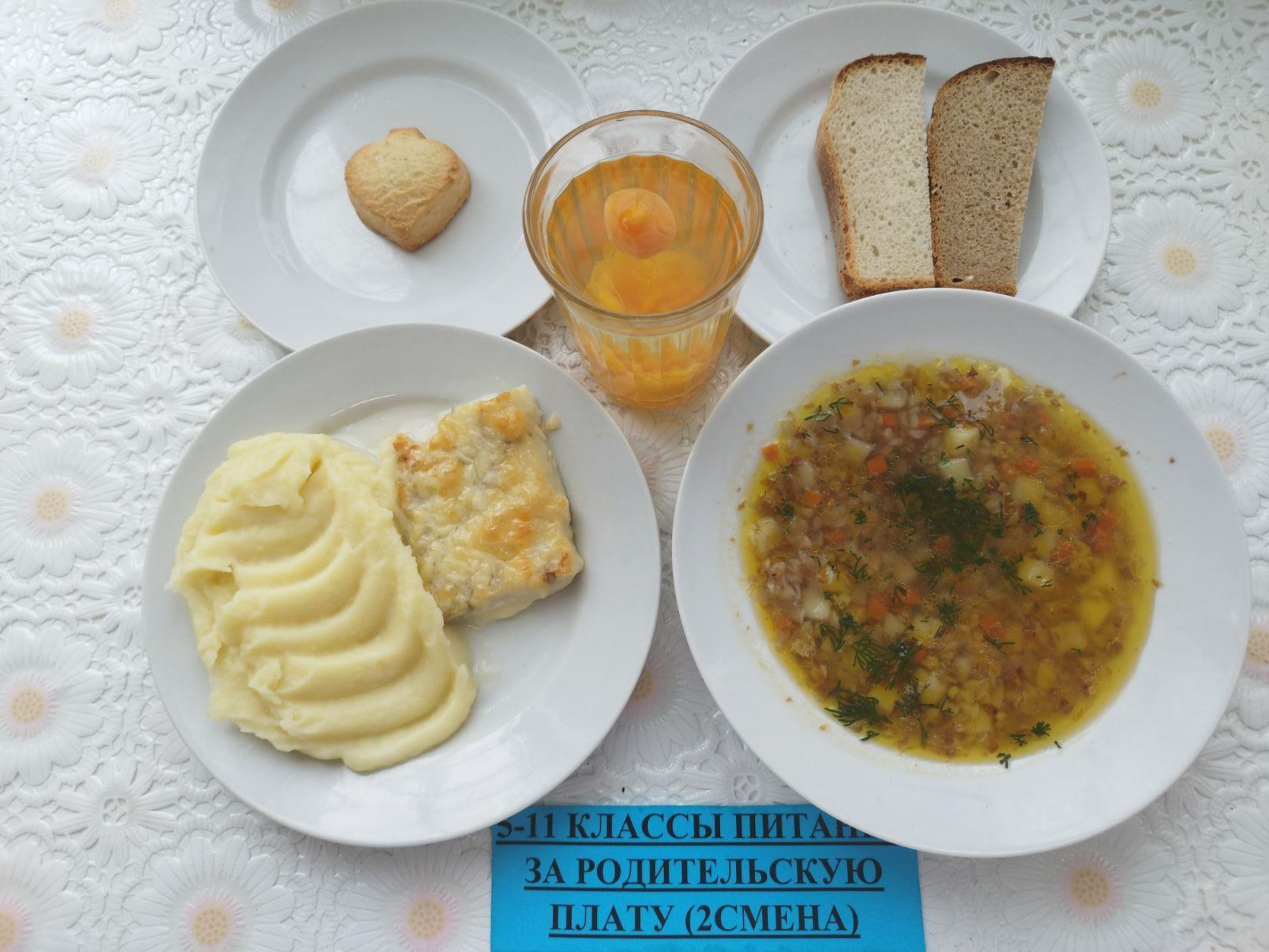
5-11 КЛАССЫ ПИТАНИЕ ЗА РОДИТЕЛЬСКУЮ ПЛАТУ (2СМЕНА)