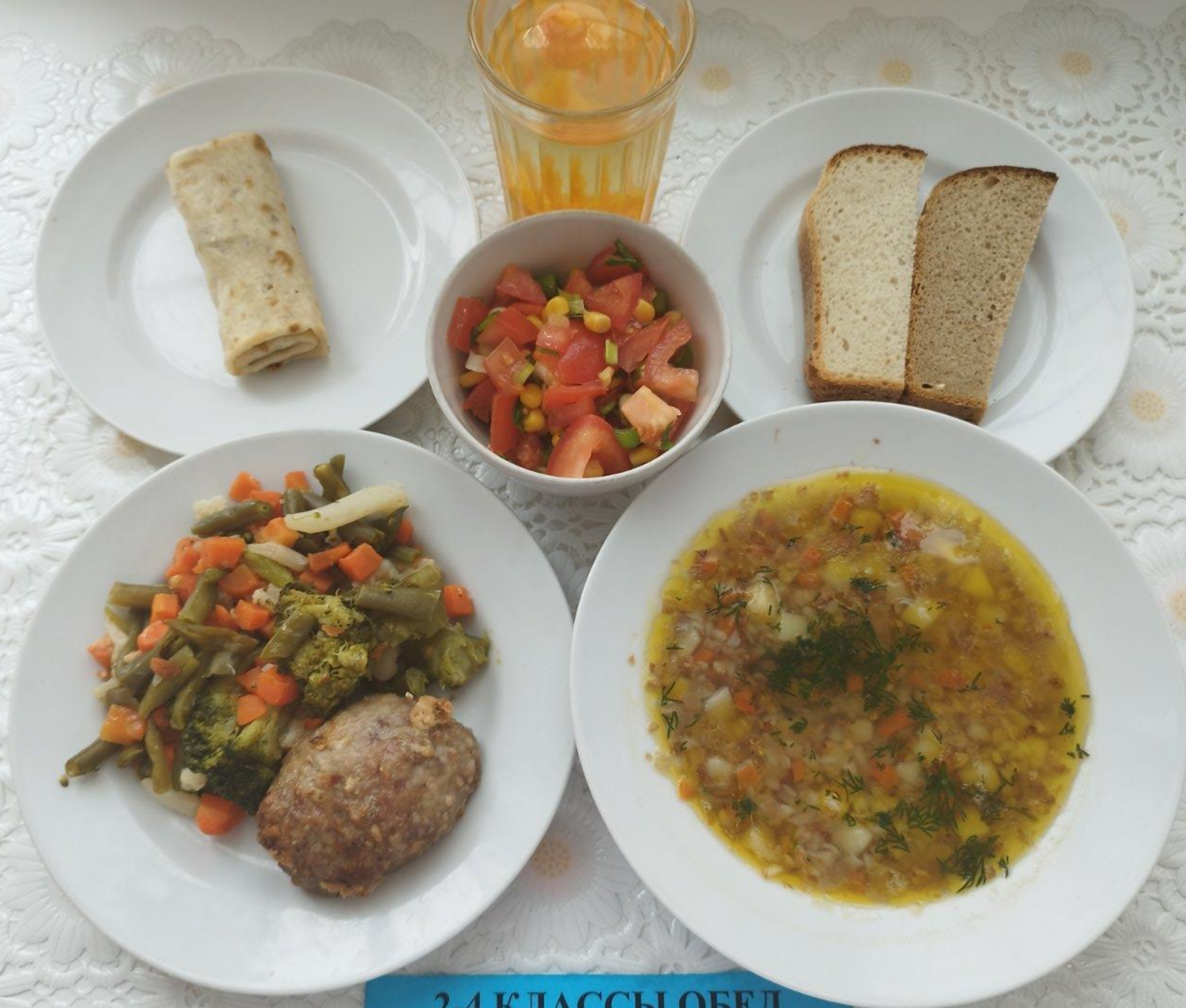
2-4 КЛАССЫ ОБЕД ЛЬГОТНОЙ КАТЕГОРИИ (1 И 2 СМЕНА)